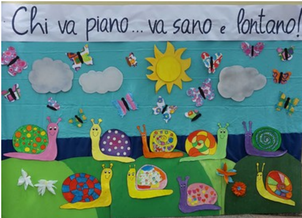
La nostra scenografia realizzata dai bambini...