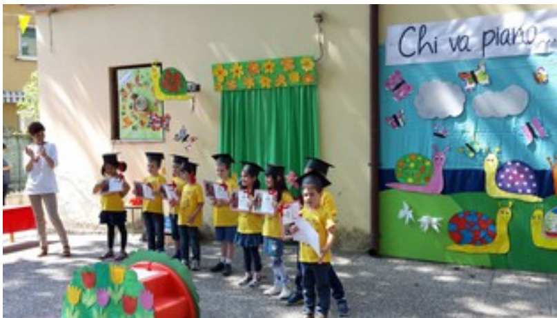
I nostri REMIGINI...