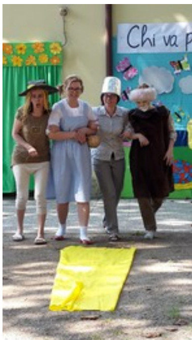
I genitori diventano attori...per NOI!